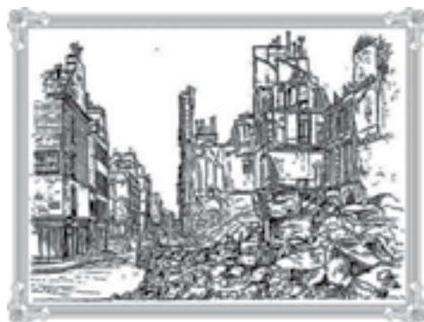
Accident ou attentat : l'atelier est une perte totale.